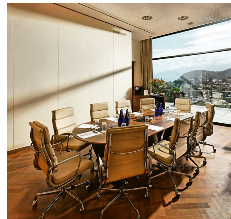
Bild links: Tagungszentrum mit Panoramaterrasse Picture left: Conference Centre with Panoramic Terrace

Kapazität/capacity: 6–12 Personen/persons Fläche/area: 33 m 2